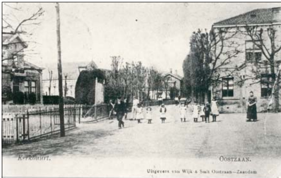
kb007-1905r (locatie) Datering: ±1905