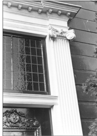
kb027-029-1960? (detail locatie) Datering: 1960 ? Bron: Kerkbuurt 027-029