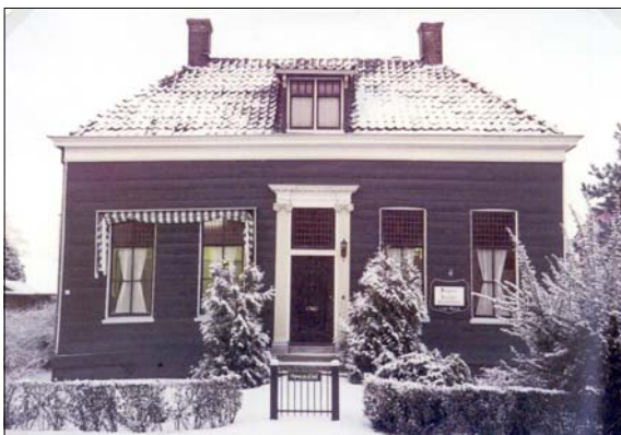
kb027-029-1970? (locatie kleurenfoto) Datering: 1970 ? Bron: Kerkbuurt 027-029