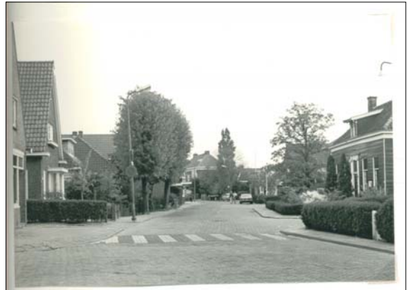
kb036-1960?(x) (locatie) Datering: 1960 ? Door:

kb027-029-1970?; Kerkbuurt 27-29; op het bordje staat nog J v Ruiven; scans fotoalbum Alie Velthuis - de Lange dd 12 mrt 2003; origineel