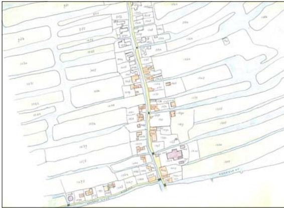
onderkaart kerkbuurt.jpg (scan) Datering: 1832 Door: Ger Muijs Copyright: SOO Bron: Kerkbuurt 000 - onderkaart