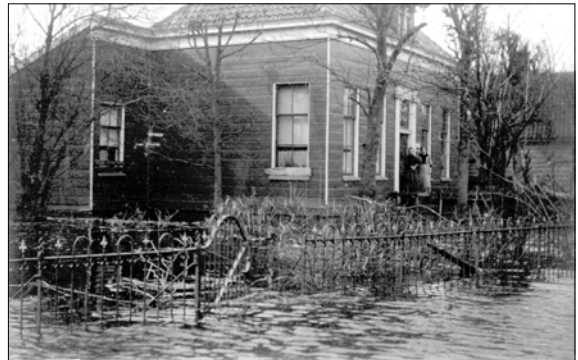
kb027-029-1916 (locatie) Datering: 1916