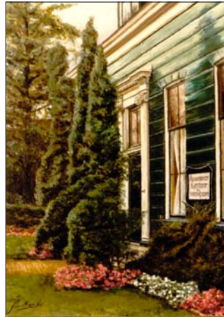
kb027-029-1984v (locatie kleurenfoto) Datering: <1984 Bron: Kerkbuurt 027-029