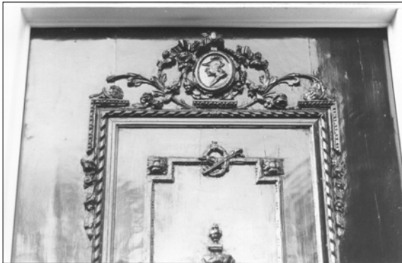
kb027-029-1960? (detail locatie) Datering: 1960 ? Bron: Kerkbuurt 027-029