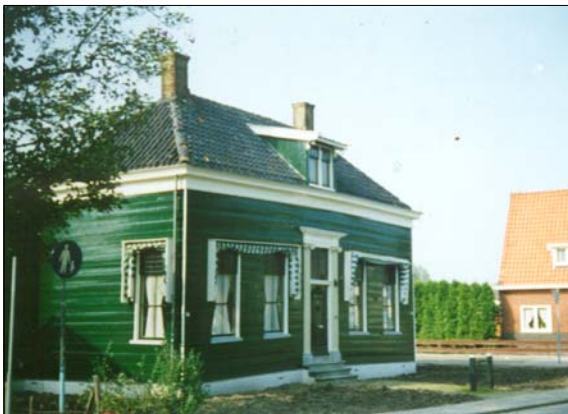
kb027-029-1992 (locatie kleurenfoto) Datering: 3 okt 1992 Bron: Kerkbuurt 027-029

kb023-1991; overzicht Kerkbuurt; vogelvlucht vanuit de kerktoeren: eerste puntdak links = kb023; postkantoor = kb025; ING (vroeger NMB) bank = kb026; Westerstijfelmakerpad; Oostzanerveld; bakkerij Honig = kb028; Foederer gebouw = kb027-029; Jacob Corneliszstraat