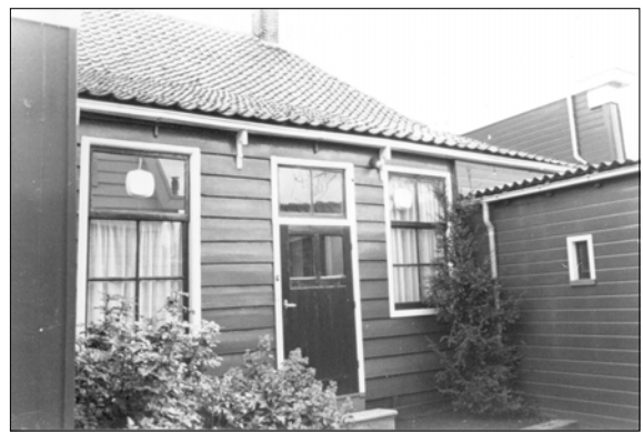
kb027-029-1960? (locatie) Datering: 1960 ? Bron: Kerkbuurt 027-029