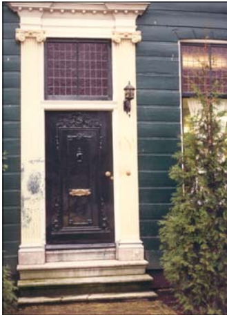
kb027-029-1980? (locatie kleurenfoto) Datering: 1980 ? Bron: Kerkbuurt 027-029