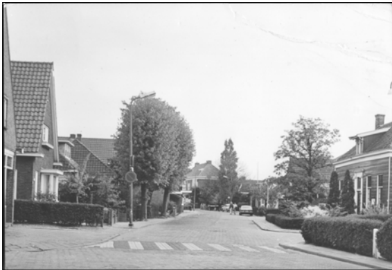
kb036-1960? (locatie) Datering: 1960 ?

kb027-029-1960?; Kerkbuurt 27-29; Foederer; detail voorgevel