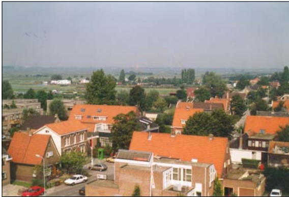
kb023-1991 (locatie kleurenfoto) Datering: 1991

kb023-1991; overzicht Kerkbuurt; vogelvlucht vanuit de kerktoeren: eerste puntdak links = kb023; postkantoor = kb025; ING (vroeger NMB) bank = kb026; Westerstijfelmakerpad; Oostzanerveld; bakkerij Honig = kb028; Foederer gebouw = kb027-029; Jacob Corneliszstraat