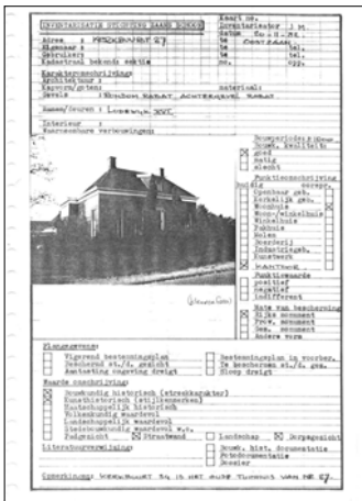
kb027-029-1982 (MIP document) Datering: 1982 Bron: Kerkbuurt 027-029-1982