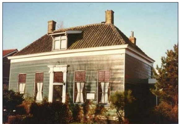
kb027-029-1980? - NIET GEBRUIKEN (NIET GEBRUIKEN) Datering: 1980 ? Bron: Kerkbuurt 027-029 - NIET GEBRUIKEN