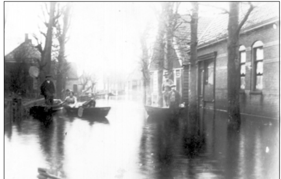
kb026-1916 (locatie) Datering: 1916